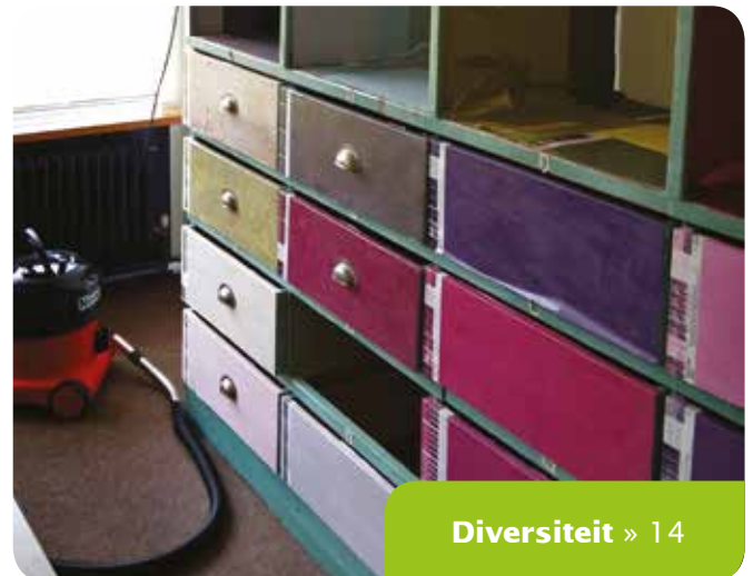
Diversiteit » 14