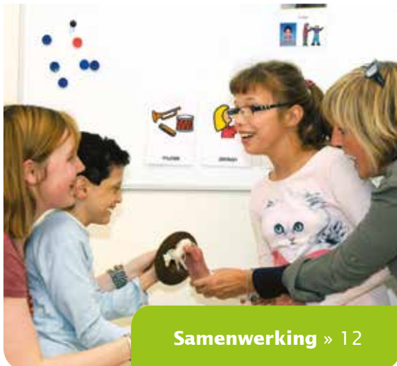
Samenwerking » 12