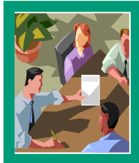
Toezichthoudende bestuurders (vrijwillig, ouders)