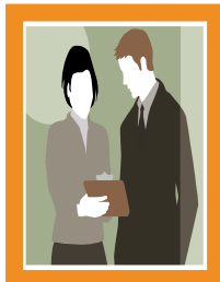
Uitvoerend bestuurders (vrijwillig, ouders)